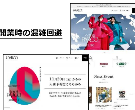
心齋橋 PARCO Web サイト