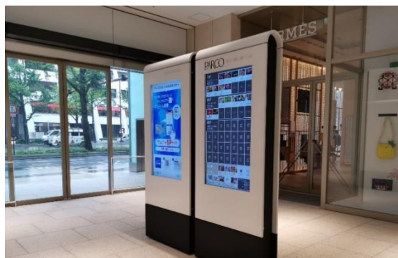
1階 風除室 デジタルサイネージ（館内全 24 拠点に導入）