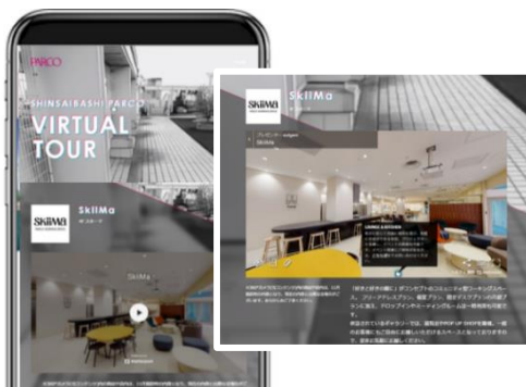
バーチャルツアー（オンラインで心齋橋 PARCO を体感）